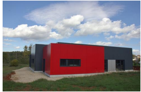
La maison de santé