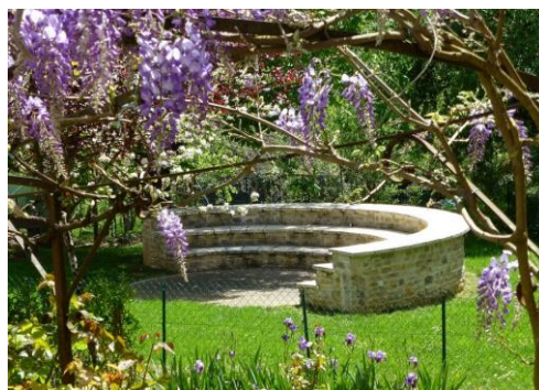
Le jardin public et son amphithéâtre de verdure