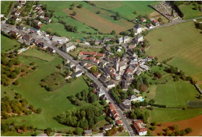
Le bourg vu du ciel