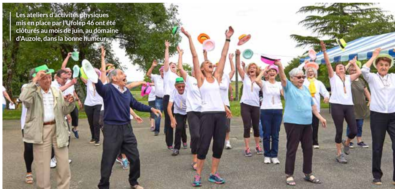
Les ateliers d'activités physiques mis en place par l'Ufolep 46 ont été clôturés au mois de juin, au domaine d'Auzole, dans la bonne humeur